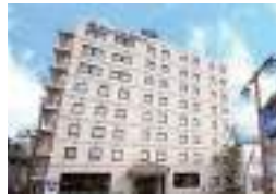
② ホテルセントパレス倉吉 倉吉市上井 1-9-2 TEL 0858-26-8888