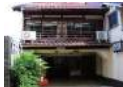
⑬ まきた旅館 倉吉市西仲町2666 TEL 0858-22-2056