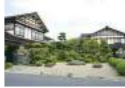
⑧ 大阪屋旅館 倉吉市山根537-1 TEL 0858-26-3731