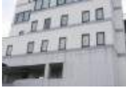
⑥ サンホテル倉吉 倉吉市山根567-5 TEL 0858-26-2060