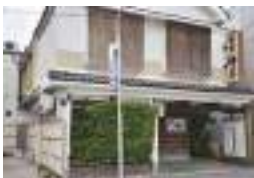
⑰ ゲストハウス 梅月旅館 倉吉市新町 3丁目2336 TEL 0858-22-1121