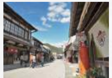
勝山町並み保存地区

蒜山高原は蒜山三座の山なみのふもとに広がり、アウトドアレジャーなどを楽しむことのできるリゾート地で、ジャージ牛などの飼育も盛ん。また勝山地区は、かつての勝山藩の城下町や出雲街道の要衝地であり、現在も古い町並みが残っている。湯原ダムの下流に位置する湯原温泉にも多くの人が訪れている。