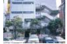
⑨ 倉吉タウンホテル 倉吉市山根540-6 TEL 0858-26-2191