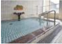
⑳ せきがね簡易宿泊施設湯楽里 倉吉市関金町関金宿1396-2 TEL 0858-45-6400