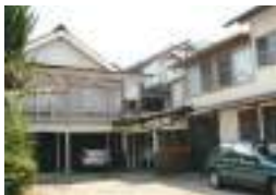
⑯ 松原旅館 倉吉市東町441-6 TEL 0858-22-2668