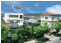
⑮ 松風荘旅館 倉吉市瀬崎町2751-1 TEL 0858-22-6363