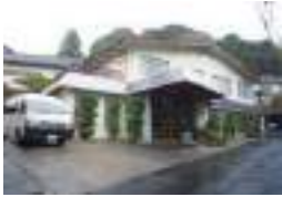
⑲ 鳥飼旅館 倉吉市関金町関金宿 1232 TEL 0858-45-2121