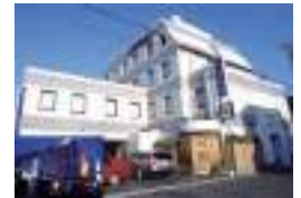
④ ビジネスイン諏訪部 倉吉市上井町 1-6-13 TEL 0858-26-2011