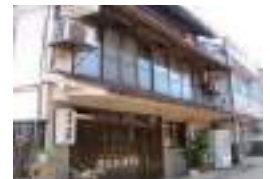
⑭ 石井旅館 倉吉市塚町 1-863 TEL 0858-22-5111