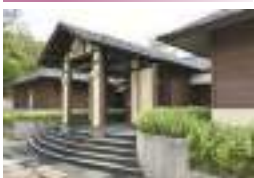
㉑ せきがね倶楽部 四季の郷 倉吉市関金町関金宿1477-8 TEL 0858-45-3973