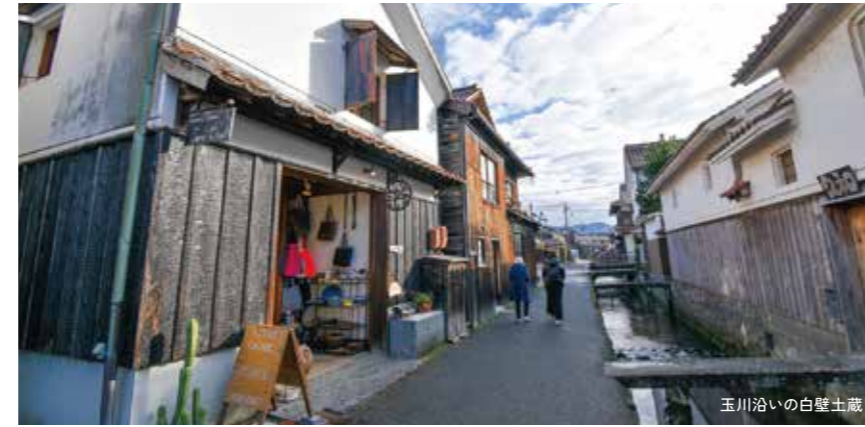
玉川沿いの白壁土蔵