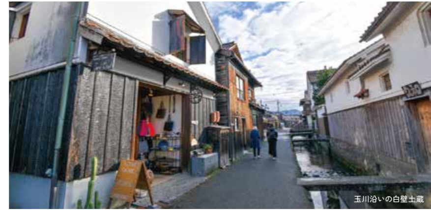
玉川沿いの白壁土蔵